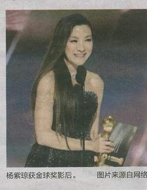
杨紫琼获金球奖影后。

金球奖主办方是好莱坞外国记者协会,因为获奖名单和奥斯卡重合度极高,也被誉为“奥斯卡风向标”。杨紫琼早前获选《时代》杂志2022年度标志人物,成为史上首位获得此项殊荣的亚裔女星。《时代》杂志介绍,杨紫琼是香港动作电影黄金时代的巨星,1997年凭铁金刚电影《明日帝国》打入好莱坞,随后又在《卧虎藏龙》《摘金奇缘》等卖座电影中饰演重要角色。(网娱)