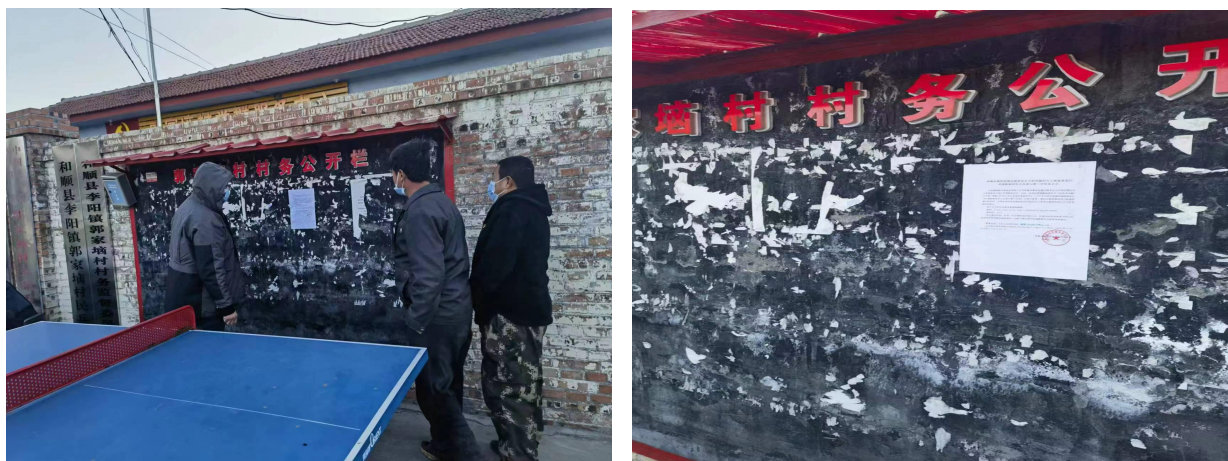
图 4 (a) 郭家塆新村公告栏张贴公示

建设单位对可能受影响的郭家塆新村、三奇村村民进行了走访，并于 2022 年 12 月 6 日至 19 日在郭家塆新村和三奇村公告栏张贴了公告，征求与该建设项目环境影响有关的意见。具体见图 4。