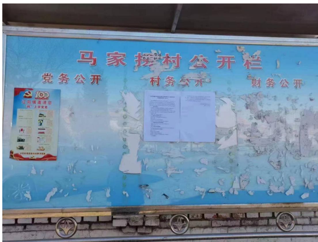
图 4-2 马家拐村张贴公示